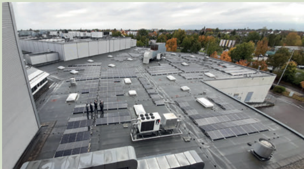
PV-Anlage auf dem Paunsdorf-Center

Strom wird direkt im Haushalt genutzt und senkt den eigenen Stromverbrauch um bis zu 20 %. Bereits 2021 haben wir uns erfolgreich mit der Förderung dieser Balkonsolargeräte durchgesetzt. Aufgrund der mittlerweile parallelen Förderung des Freistaats richtet sich das Leipziger Programm ab 2024 an Menschen mit Leipzig-Pass mit 500 Euro Förderung (max. 100% der Kosten).