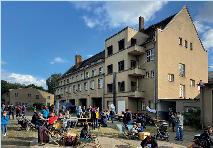
Ostwache in Anger-Crottendorf

Nicht zuletzt hat der Stadtrat 2023 die Stadtverwaltung auf unsere Initiative hin beauftragt, eine Stelle zur Wohnungsbaukoordination zu schaffen. Hamburg hat dies bereits 2010 realisiert und die im Hamburger Bündnis für Wohnen vereinbarten Zielmarken seitdem immer erreicht. Wir wollen diesem Beispiel folgen und so eine Beschleunigung und stärkere Koordination der komplizierten Planungs- und Genehmigungsprozesse erreichen. Der/die Wohnungsbaukoordinator*in wird bei Verfahrenshemmnissen Ansprechperson für Investierende sein und sich um verwaltungsinterne Abstimmungsprozesse kümmern, in Wohnungsbaukonferenzen Zielkonflikte offenlegen und so bestehende Dissense zielgerichtet auflösen, um die dringend notwendige Schaffung von Wohnraum zu beschleunigen.