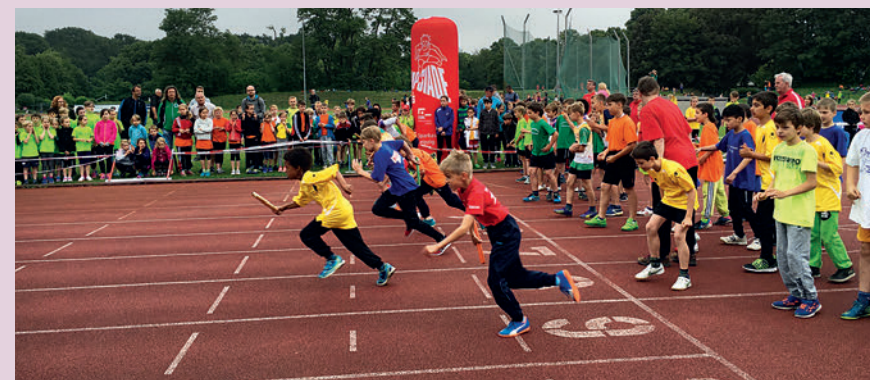
Lipsiade – Staffellauf der Grundschulen

In Grünau wurde Ende 2021 am Heizhaus der tolle, neue städtische Skatepark auf 4.500 Quadratmetern eröffnet, den täglich fast 150 junge Menschen nutzen. Weil der Bedarf an Skateanlagen in unserer Stadt groß ist, haben wir uns im Rahmen einer Petition dafür eingesetzt, weitere Potenzialflächen zu eruieren und perspektivisch zu entwickeln. Gleiches gilt auch für Mountainbikestrecken , von denen es ja gleich mehrere „illegale“ im Auwald gibt. Zum Schutz unseres Naturschutzgebiets Leipziger Auwald haben wir die Suche nach möglichen Alternativen beauftragt. Nach unserer erfolgreichen Initiative von 2015, einen neuen Schwimmhallenbau im Leipziger Osten zu beauftragen, wird dieses Sportbad Anfang 2025 neben dem Rabet endlich eröffnet. Und auch im Leipziger Süden schreitet die Planung voran. Nach unserem erfolgreichen Antrag im Rahmen des Sportprogramms wird an der Bornaischen Straße bis 2030 eine weitere 25-Meter-Halle gebaut.