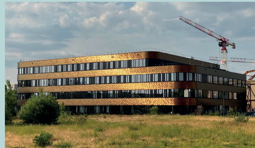
Deutsches Zentrum für integrative Biodiversitätsforschung – iDiv

Auch für den zweiten Arbeitsmarkt können wir eine positive Bilanz ziehen. Es wurden viele Anstrengungen unternommen, einerseits die Menschen zu qualifizieren und fit für den ersten Arbeitsmarkt zu machen. Andererseits konnten wertvolle Strukturen bei den Schulbibliotheken, der Stadtsauberkeit etc. geschaffen werden. Umso mehr sorgen wir uns angesichts der massiven Einsparungen des Jobcenters, wie wir die aktuell und künftig wegfallenden geförderten Stellen kompensieren können. Wir haben bereits Ende 2019 die Verwaltung beauftragt, ein Personalentwicklungskonzept zur Qualifizierung von Beschäftigten in arbeitsmarktpolitischen Maßnahmen zur Verbesserung der Chancen der Übernahme in eine Festanstellung zu erarbeiten.